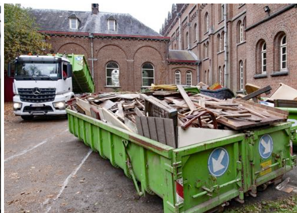
De ontruiming van de zolder van de noordvleugel door een ploeg van IGO.